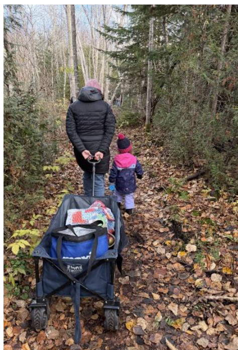
Découverte des affiches avec les enfants de la Maison des familles de la Matanie.

Les aménagements sont dès maintenant accessibles au sentier du Buisson et aux sentiers Bon-Pasteur . Une signalisation y est installée et guide les familles vers des haltes de 2 à 5 minutes, sans matériel requis. Un déploiement graduel se poursuivra sur l'ensemble de La Matanie tout au long de l'automne 2025.