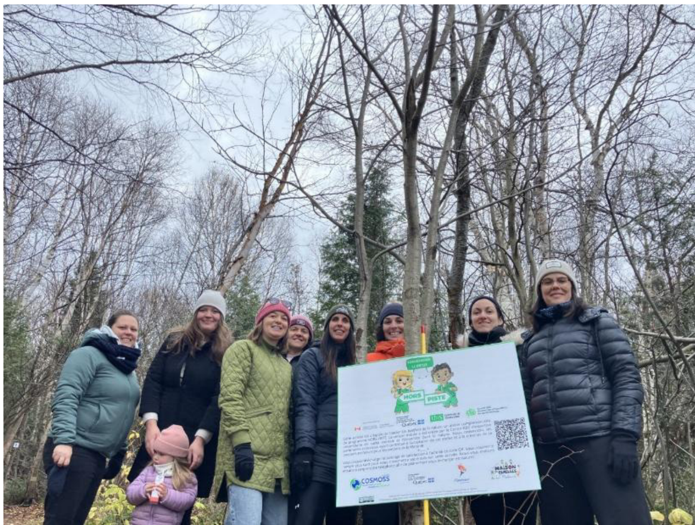
Comité de mise en oeuvre et parents

Le programme HORS-PISTE, initié par le Centre d'expertise universitaire en santé mentale de l'Université de Sherbrooke, vise la prévention des troubles anxieux et d'autres difficultés d'adaptation chez les jeunes.