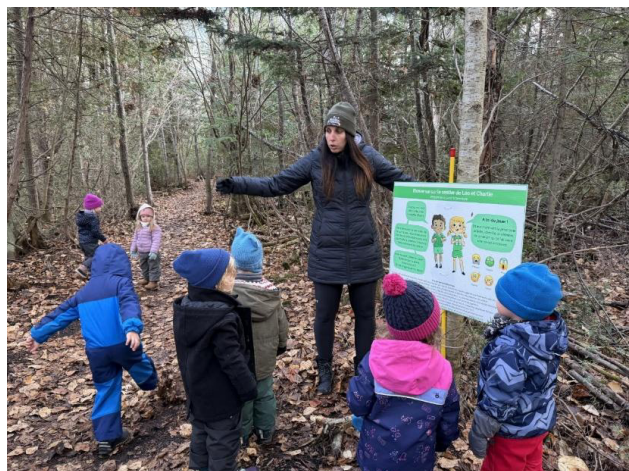
Découverte des affiches avec les enfants de la Maison des familles de la Matanie.

Cette initiative, réalisées en collaboration avec l'équipe COSMOSS de la MRC de La Matanie , Les Flambeaux de La Matanie et le programme québécois HORS-PISTE , mise sur le développement de compétences socio-émotionnelles et sur les bienfaits de la nature pour favoriser la santé mentale des jeunes et de leur entourage.